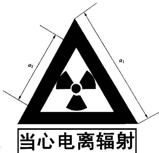
图 F2 电离辐射警告标志

电离辐射的警告标志如图 F2 所示。警告标志的含义是使人们注意可能发生的危险。其背景为黄色，正三角形边框及电离辐射标志图形均为黑色，“当心电离辐射”用黑色粗等线体字。正三角形外边 a_1 = 0.034L ，内边 a_2 = 0.700a_1 ， L 为观察距离。